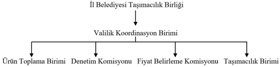
Şekil 2: İl Belediyesi Taşımacılık Birliği 2